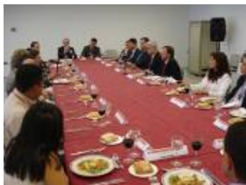
Almuerzos de trabajo ALAMYS-MAFEX

FORMATO: Reuniones individuales, ponencias, visitas técnicas, almuerzos de trabajo y visitas a empresas.