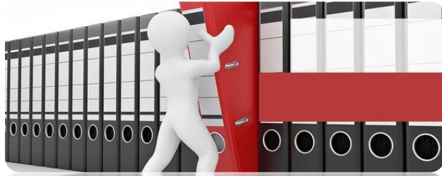
DOCUMENTAÇÃO DE ENTRADA