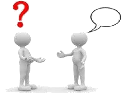
PERGUNTAS / ENTREVISTAS