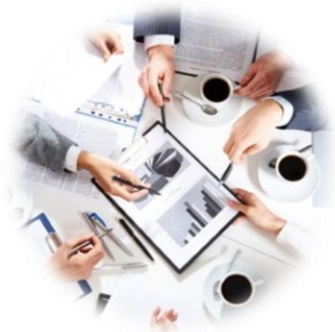
REUNIÕES / AUDITORIAS