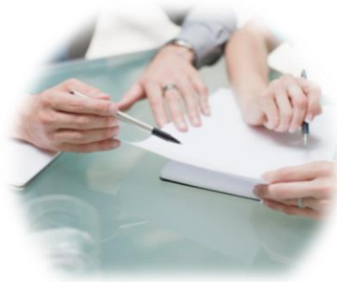
ANÁLISE DA DOCUMENTAÇÃO