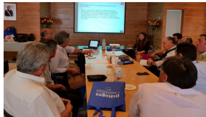
Referencia: Capacitación a conductores de buses, Rancagua, diciembre 2017.

Avanzar en temáticas como seguridad, concientización, educación, información, visibilización, sensibilización, prevención, solidaridad.