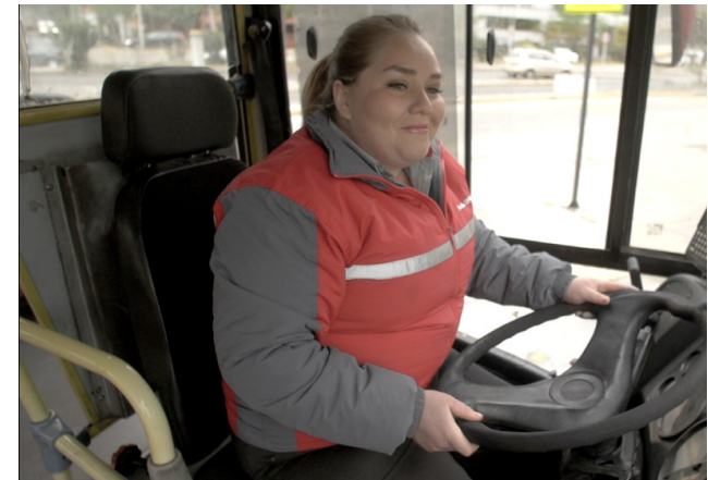
Fotografía Política y equidad de género MTT, 2018.