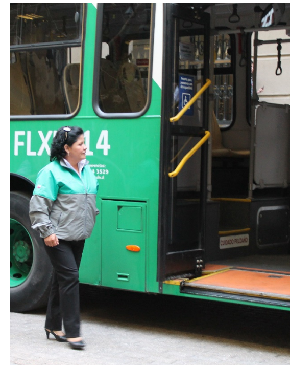
Fotografía Política y equidad de género MTT, 2018.