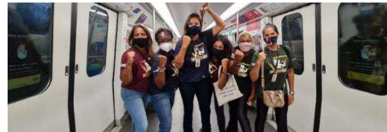
Campanha de Comunicação Externa