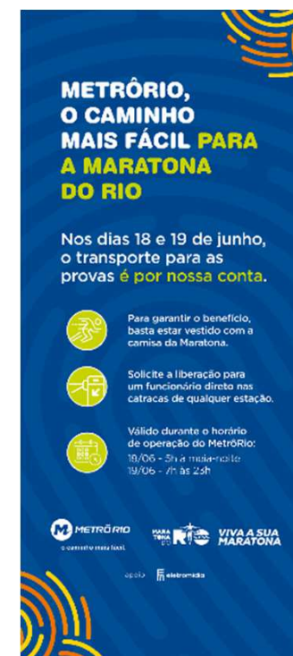
Campanhas de Comunicação Externa