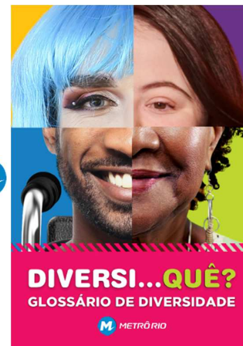
Campanha de comunicação Interna