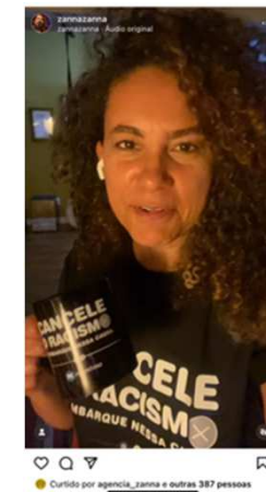
Campanha de Comunicação Externa