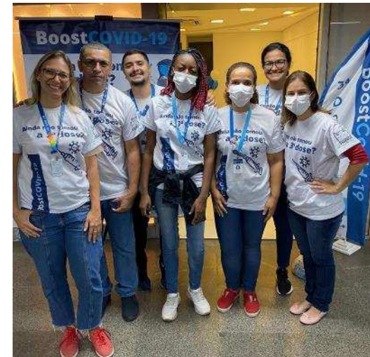
Campanha de Comunicação Externa