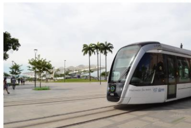
Visitas do Amanhã no metrô: crianças de família gratuita

Por Natália Lima Neto 08/03/2022 - 11:02 - Atualizado em 8/3/2022