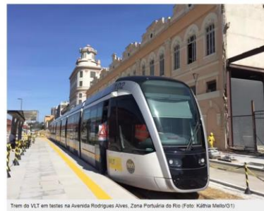
Trem do VLT em testes na Avenida Rodrigues Alves, Zona Portuária do Rio