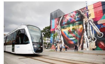
Carão-ponte: Trem do VLT passa por um dos painéis do artista plástico Eduardo Kobra, região entrou para a agenda de programação de quem vem ao Rio