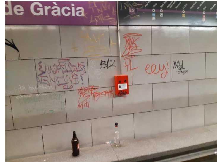
Convocatorias de Subway Parties